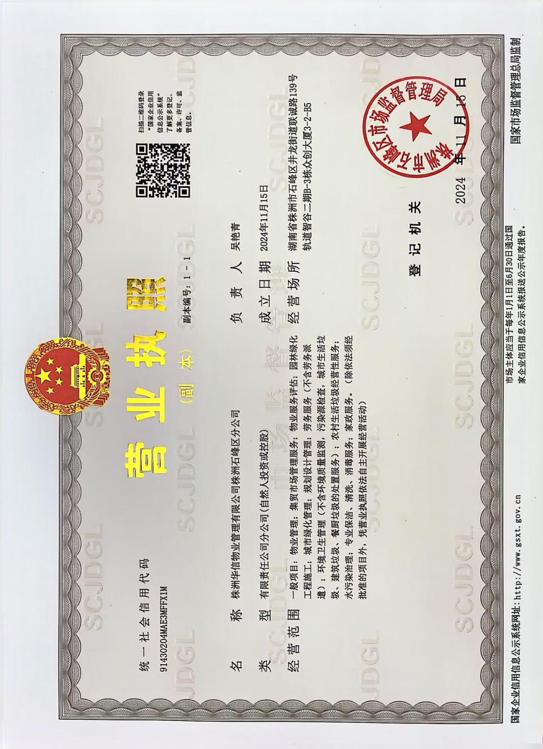
石峰区分公司营业执照副本扫描件